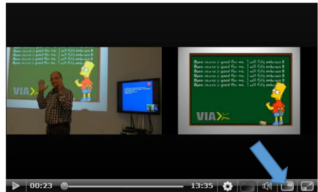
PC præsentation og kamera med underviser lige store (Præsentation til højre)