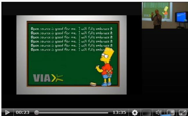
PC præsentationen relativ stor Kamera med underviser relativ lille

Følgende 6 visninger er mulige ved klik på knappen nederst til højre