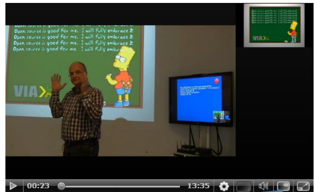
Kamera med underviser relativ stor PC præsentation relativ lille