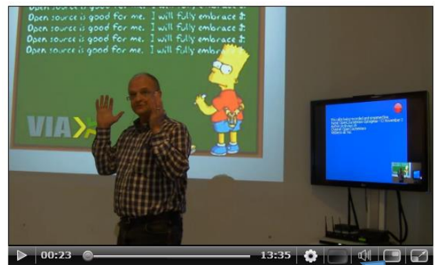
Kun kamera med underviser vises