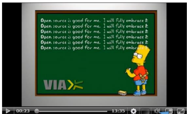
Kun PC præsentation vises