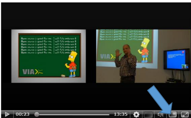
PC præsentation og kamera med underviser lige store (Præsentation til venstre)